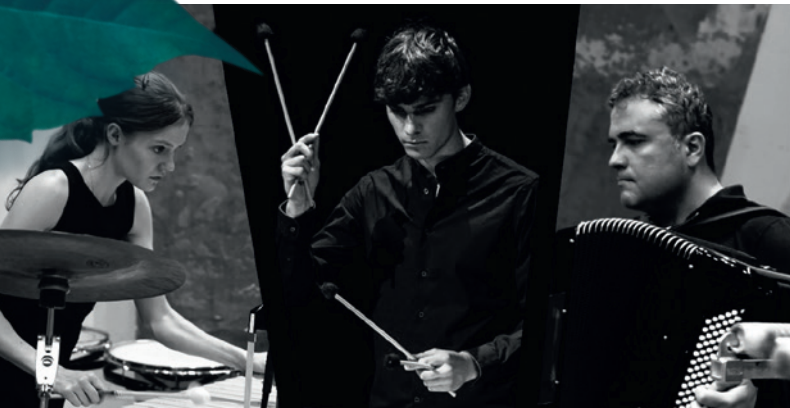
Trio K/D/M